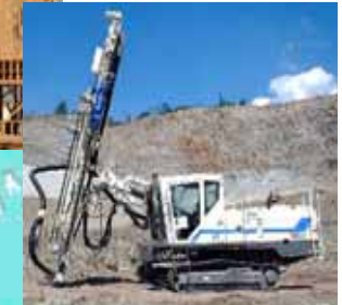
< 油圧クローラドリル(北米) >