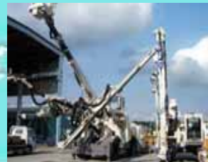
< ウイングブームジャンボ(中国) >