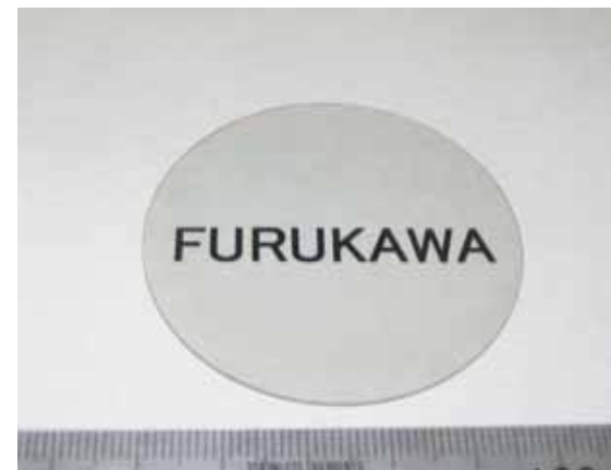
<窒化ガリウム自立基板>