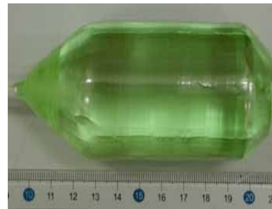
<高性能シンチレータ結晶>

(*)Positron Emission Tomography:陽電子放出断層撮影