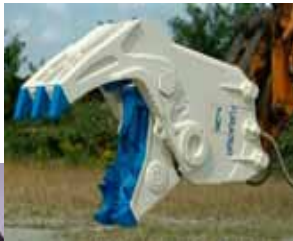
< 圧碎機(欧州) >