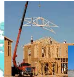
< 大型ユニッククレーン(北米) >