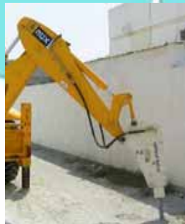
< 油圧ブレーカ(中近東) >