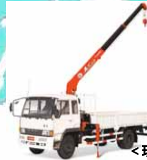
< 現地架装クレーン(中国) >