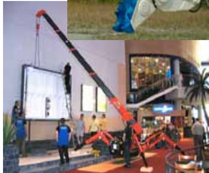
< 室内にて使用される ミニクローラクレーン(欧州) >